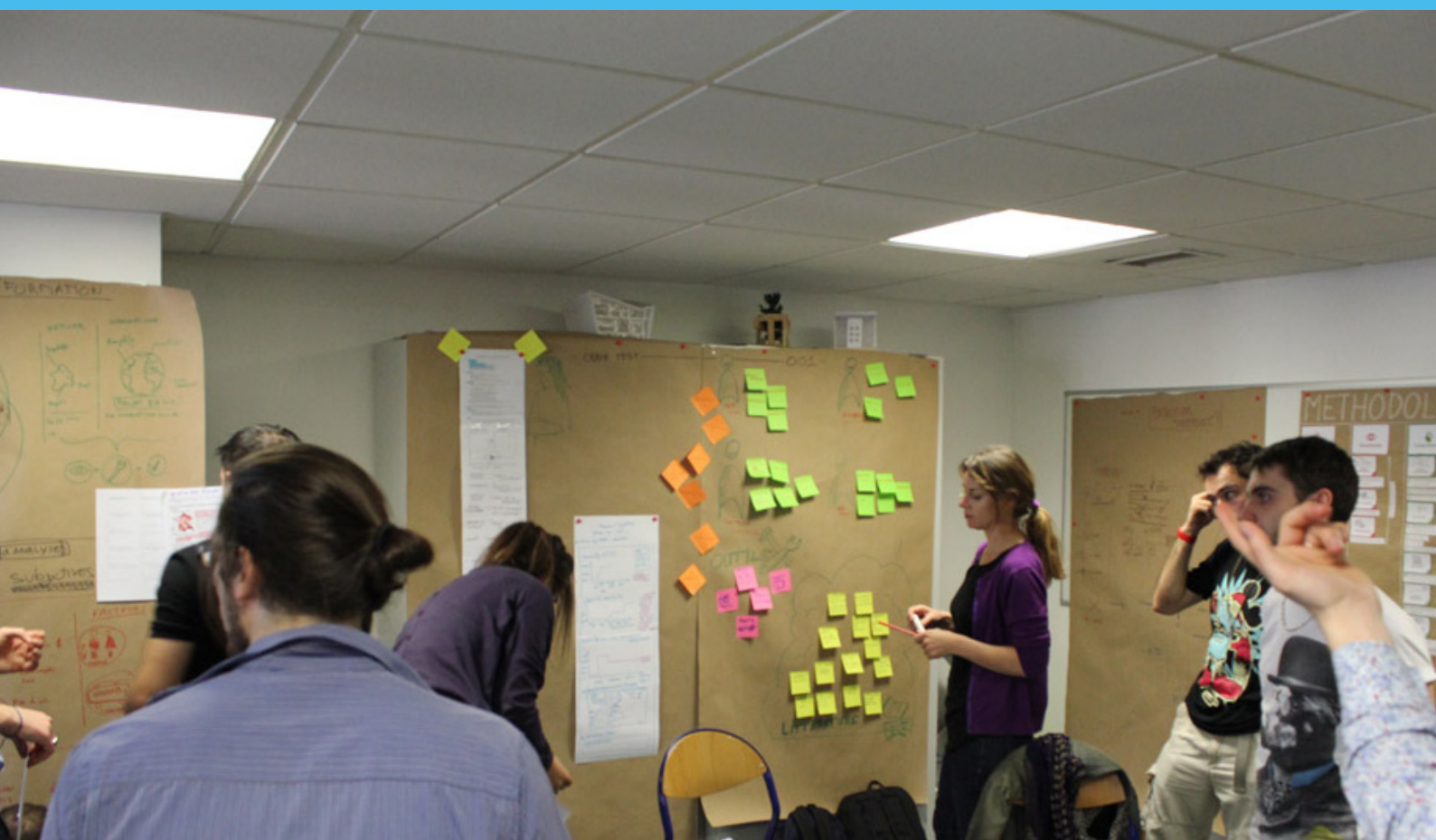
Brainstorming sur la problématique de l'emploi et de la formation en partenariat avec la 27 ème Région. Mars - Juin 2012.

Le design de service met en valeur et facilite les relations et les interactions humaines entre bénéficiaires ou/et fournisseurs concevant des outils médiatiques.